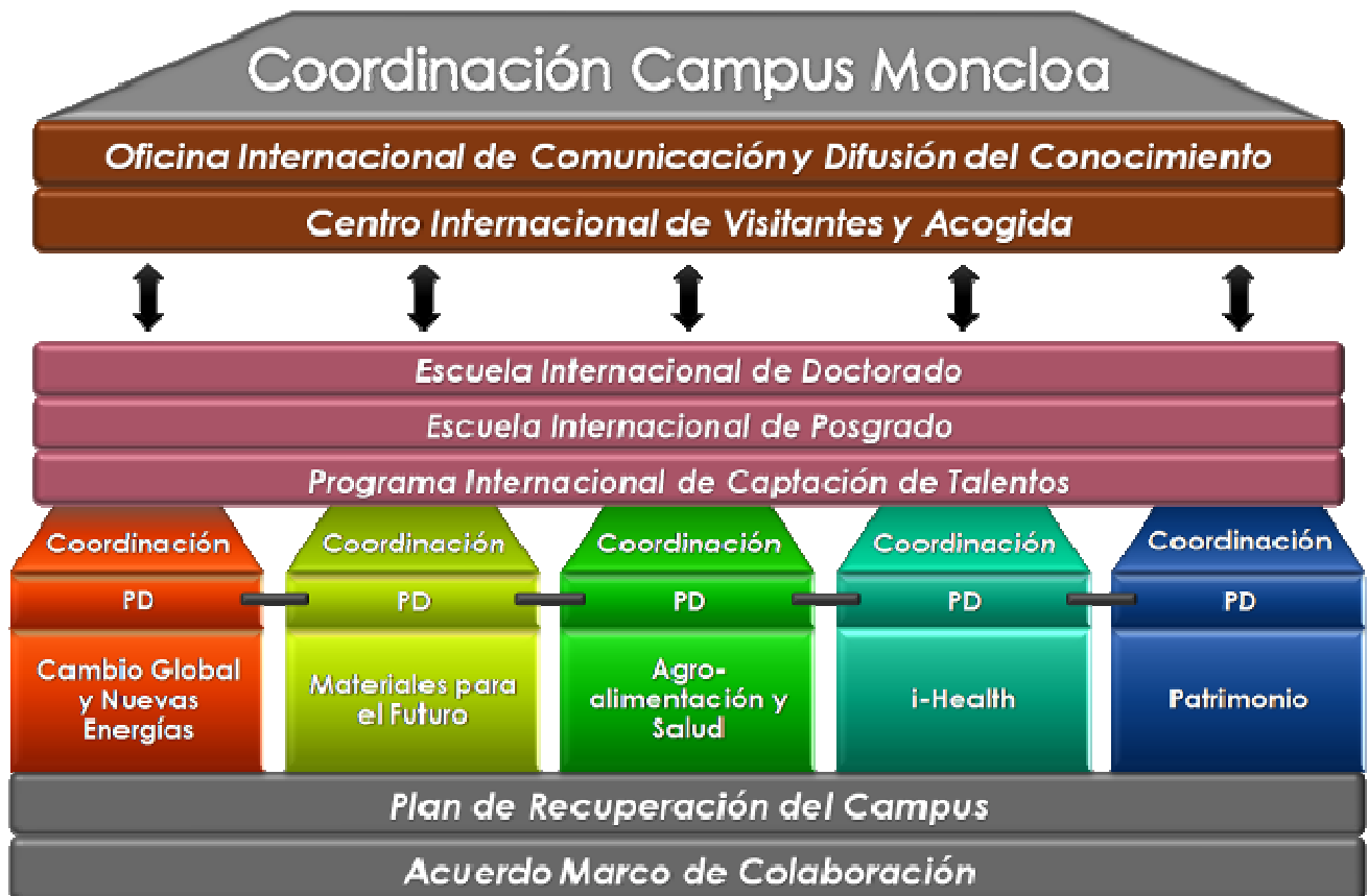
Plan Director (PD)

actividades en diversos campus. Como ya se definió en el proyecto original, para el desarrollo del Campus de Excelencia Internacional es necesario contar con las disciplinas, conocimientos, capacidades y recursos de calidad sitos en el conjunto de instalaciones y campus de la UCM y la UPM que abordan las temáticas definidas en los clústeres. De este modo, sin perder la idiosincrasia ni la estructura del proyecto de Campus de Moncloa y la referencia de su ubicación, se enriquece superando el concepto de campus puramente geográfico, abriéndose, por ejemplo, a la aportación de grupos de ciencias sociales, empresariales y tecnológicos ubicados en Somosaguas o en otros centros de la UPM.